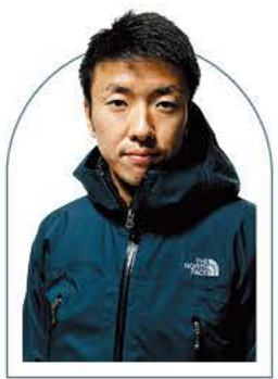
講師 石川直樹 (写真家)

「写真技術を習得するのは容易だが、写真について考えを深めていくのはそんなに簡単ではない。普段は当たり前すぎて思い返すことなどないことを、もう一度ゼロから思考し直す必要があるからだ。でも、だからこそ思いがけないことに気づく。ぼくは「フォトアーキペラゴ写真学校」を、学びの場である以上に、気づきの場になればいいなあと思っている。」